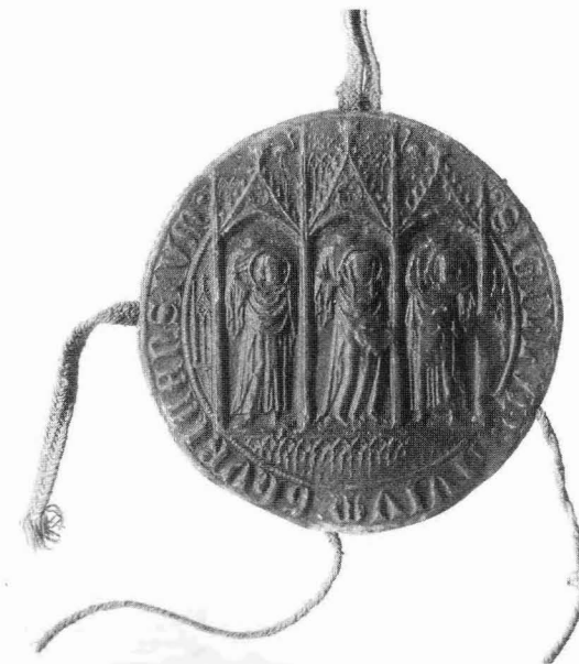
Abb. 2: Siegel der Stadt Zürich, 1347 (Staatsarchiv, Zürich)